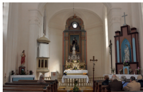
KOSTEL SV. JANA NEPOMUCKÉHO ŠEMANOVICE

Žehnání pokrmů se bude konat na Bílou sobotu v kostele sv. Petra a Pavla po večerní mši svaté.