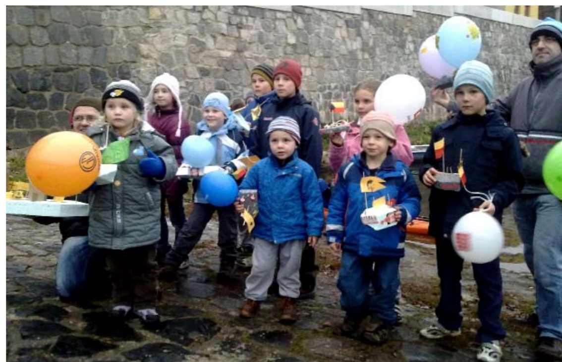
V listopadu tátové pomohli dětem postavit lodičky a poslat je po vodě.